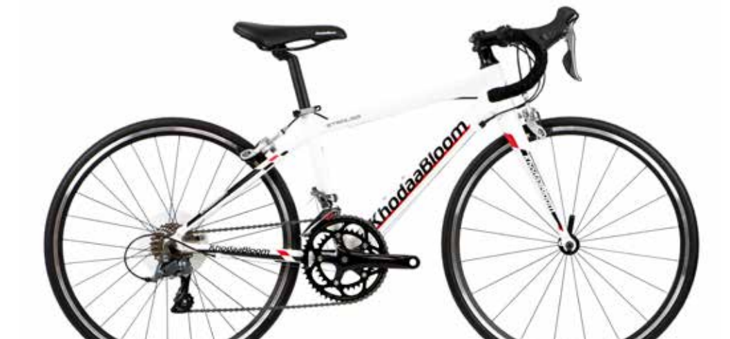
レーシングホワイト