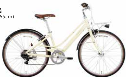
マットアイボリー