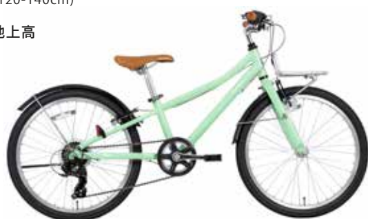
マットミントグリーン