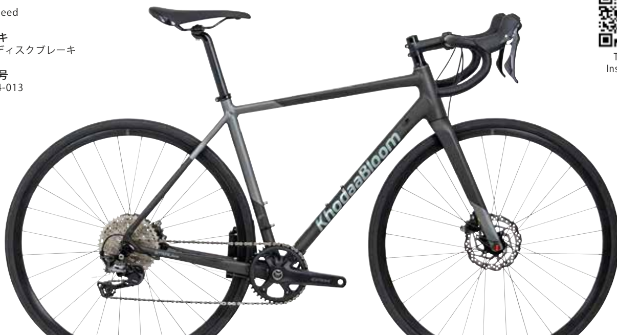
マットラッシュグレー