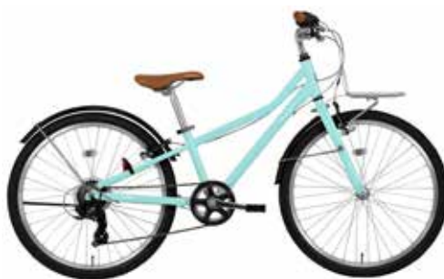
マットパステルブルー