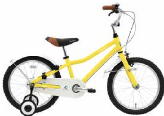
マットパステルイエロー