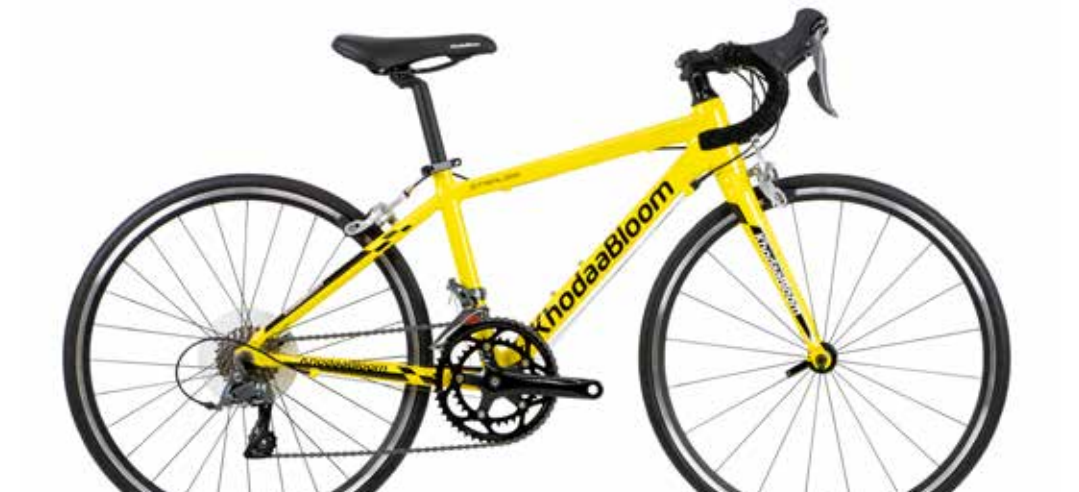
レーシングイエロー