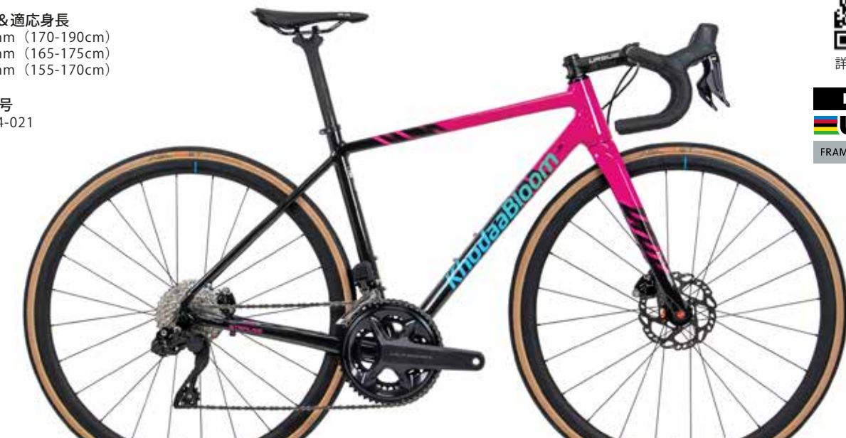
ブラック/ピンク (完成車組立例)