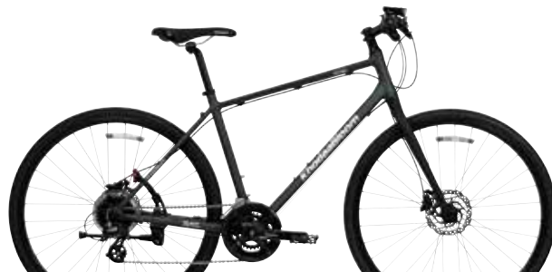
マットダークグリーン