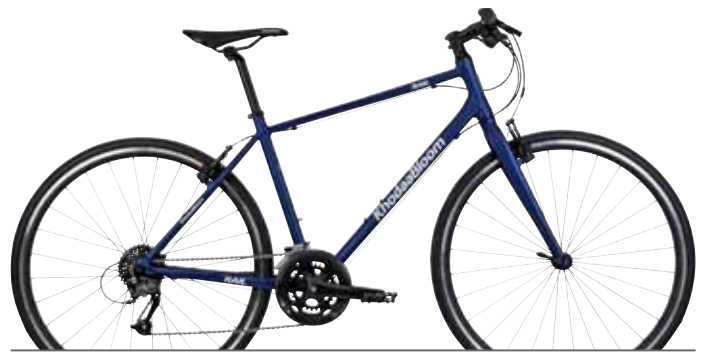
マットダークブルー