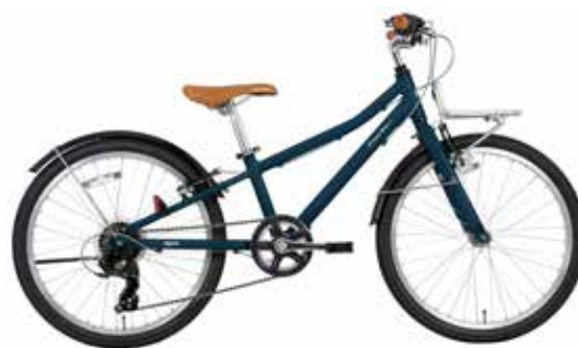
マットネイビーブルー