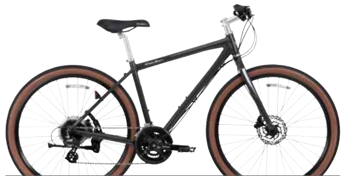
チャコールブラック