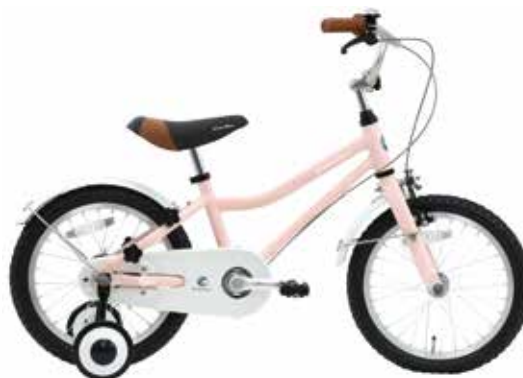
マットパステルピンク