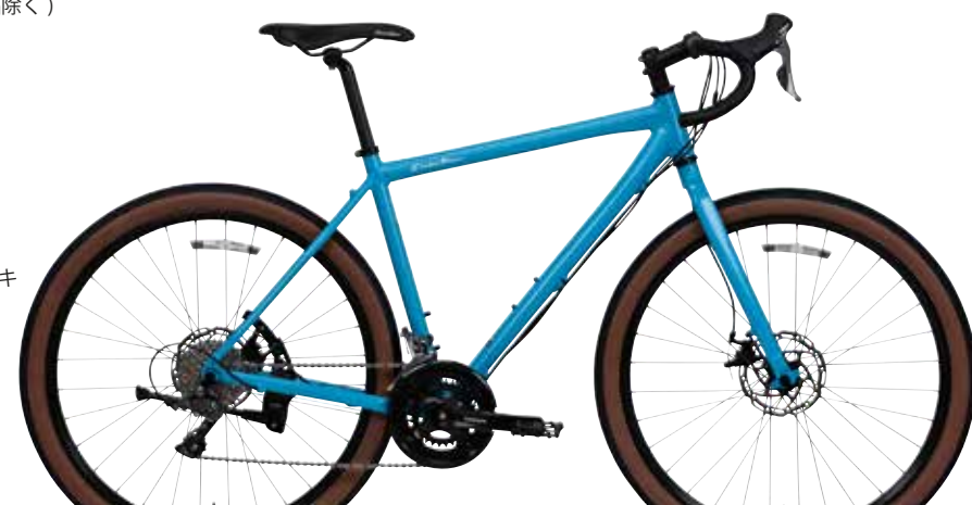
マットスカイブルー