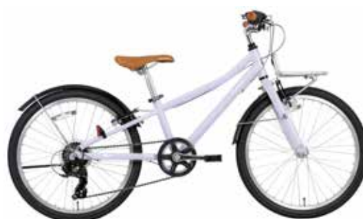
マットラベンダーパープル