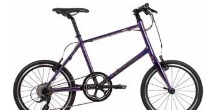
オーロラパープル