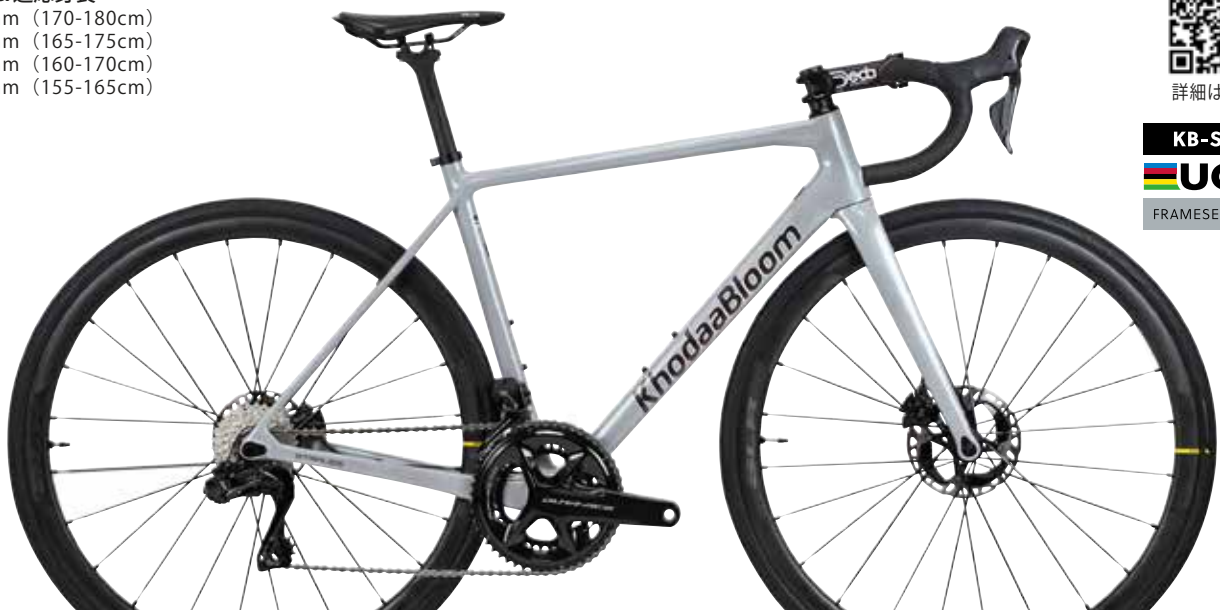
シルバー (完成車組立例)

サイズ&適応身長 520mm (170-180cm) 490mm (165-175cm) 470mm (160-170cm) 450mm (155-165cm)