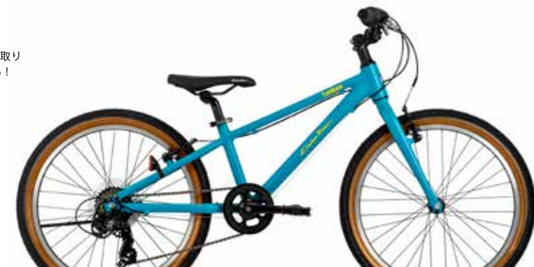
マットターコイズブルー

オプションのフロントキャリアとバスケットを取り付け可能！積載が可能になって活動範囲が広がる！ ※使用オプションパーツ (29 ページに詳細) ・Vブレーキ止めフロントキャリア ・ワイヤーバスケットワイドタイプ