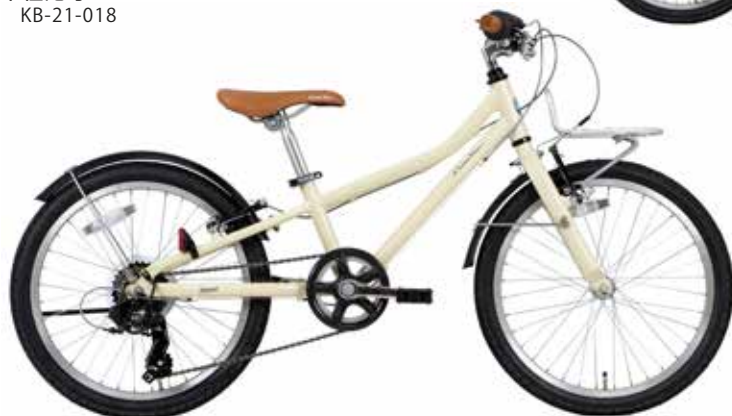
マットアイボリー