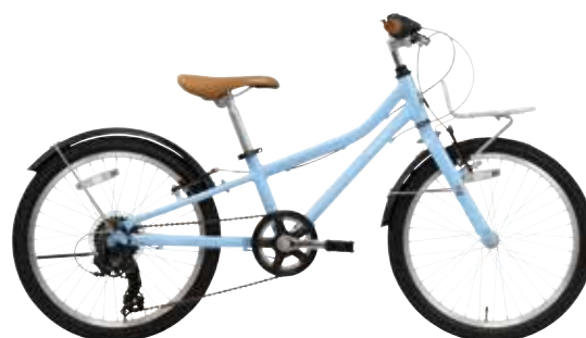
マットスカイブルー