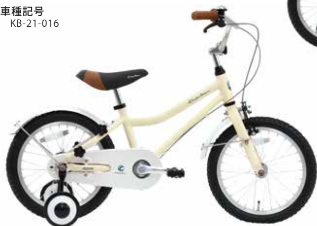
マットアイボリー