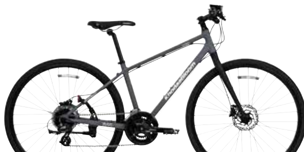
マットソリッドグレー

*国内販売中の 10 万円以下、フロント変速付きの油圧ディスクブレーキ採用のクロスバイク (2023 年 7 月当社調べ)