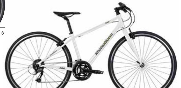
ソリッドホワイト

※国内販売中の10万円以下、フロント変速付きのリムブレーキ採用のクロスバイク (2023年7月当社調べ)