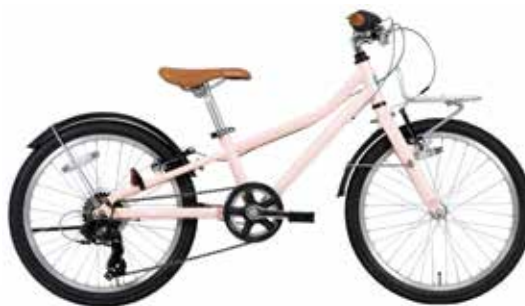
マットパステルピンク