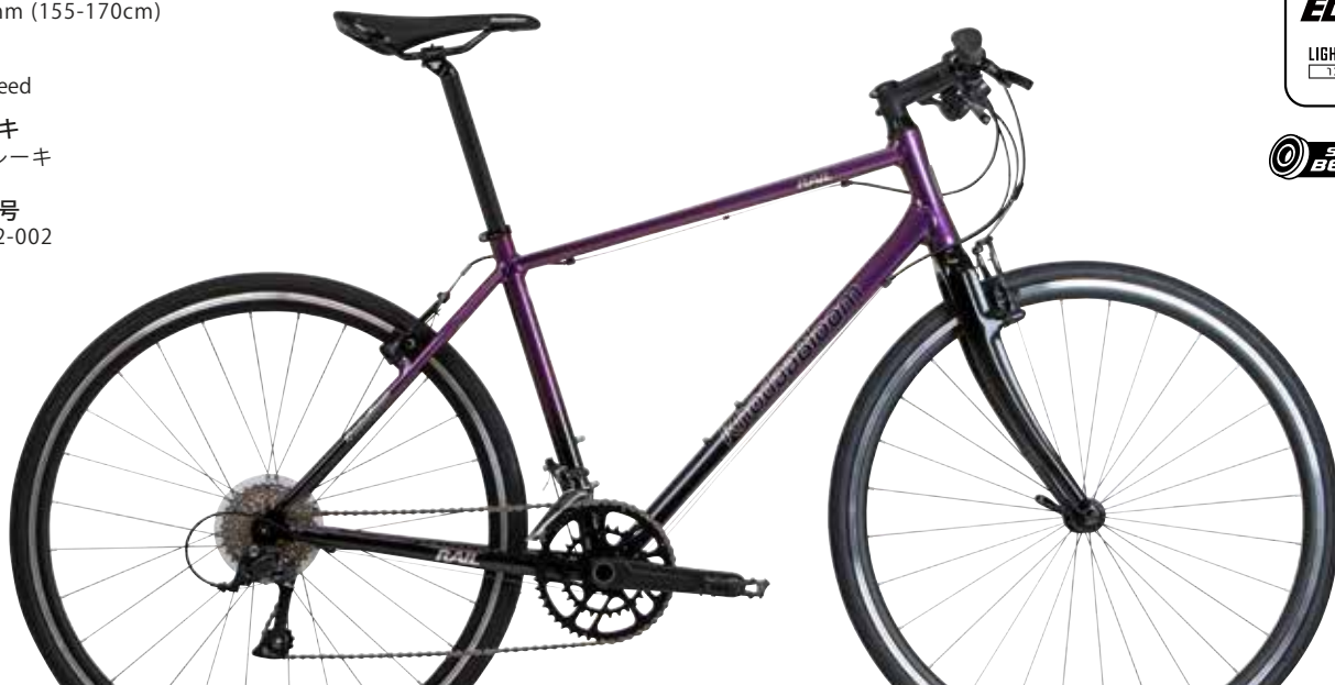
オーロラパープル/ブラック

※国内販売中の20万円以下のクロスバイクにおいて最軽量(2023年7月当社調べ)