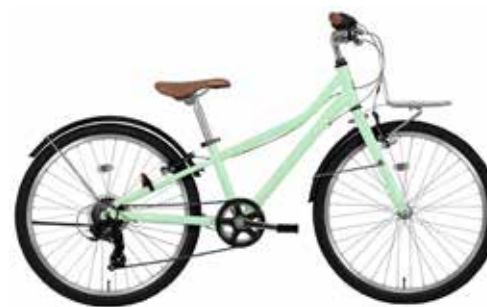
マツトシャーベットグリーン