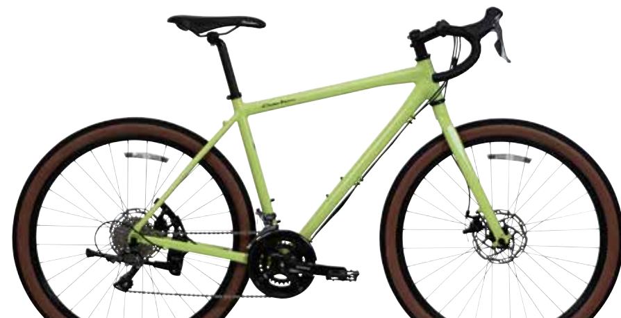
ピスタチオグリーン