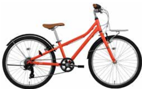
マツトスカーレットレッド