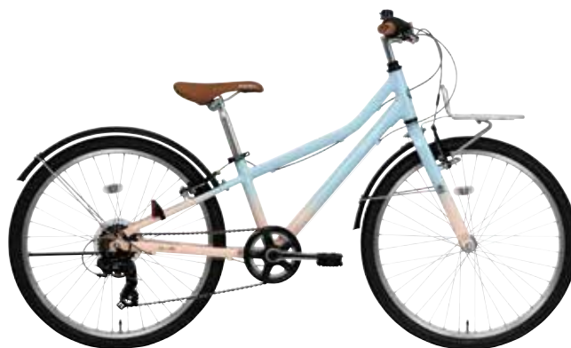
マーメイドブルー