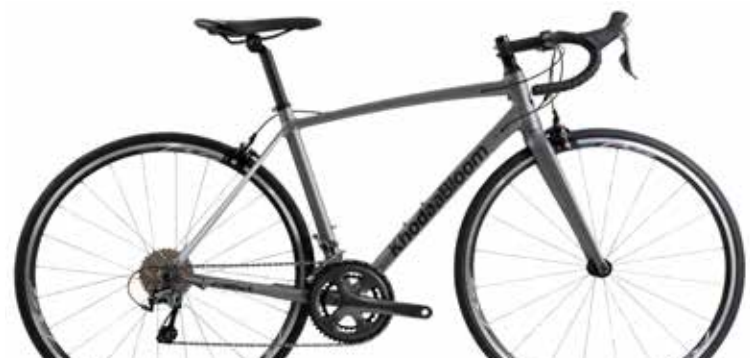
マットガンメタル