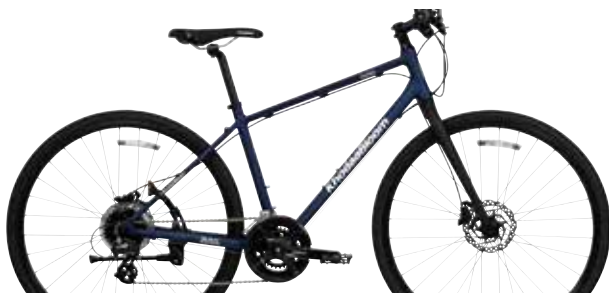
マットダークブルー