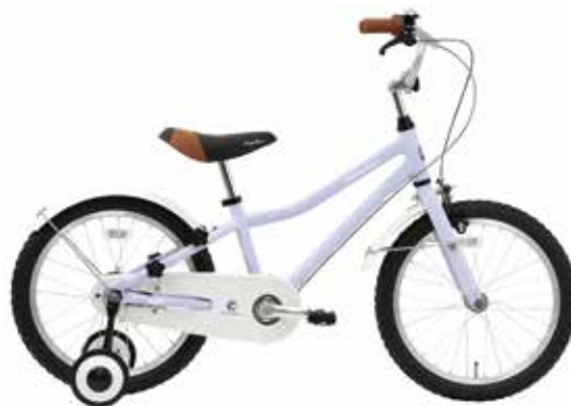
マットラベンダーパープル