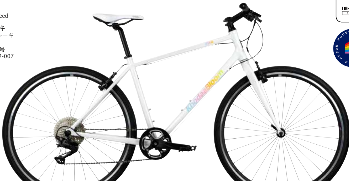
ホワイ (グラデーションロゴ)