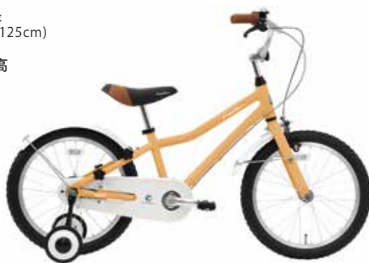
マットキャメルベージュ