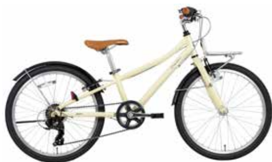
マットアイボリー