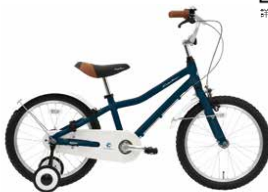
マットネイビーブルー