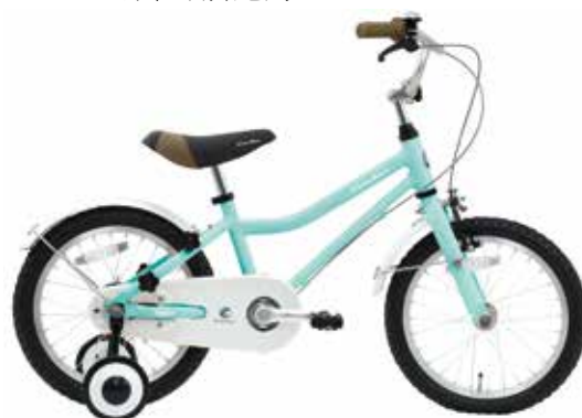
マットパステルブルー