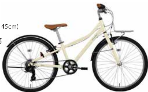
マットアイボリー