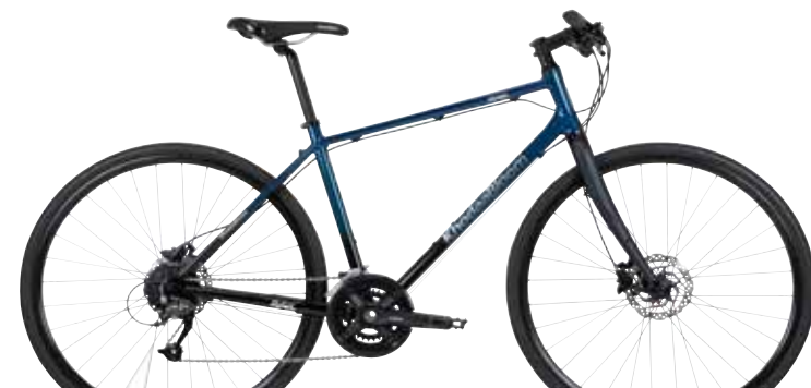
コバルトブルー/ブラック