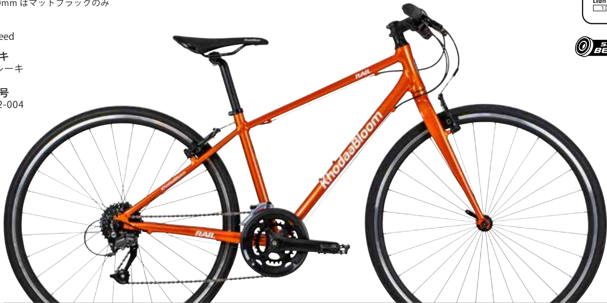
シャイニーオレンジ