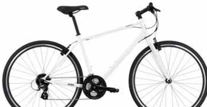
シャイニーホワイト