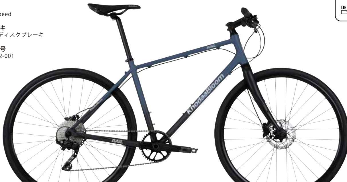
マットスレートブルー