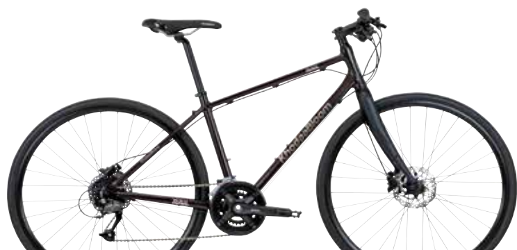
マットダークブラウン