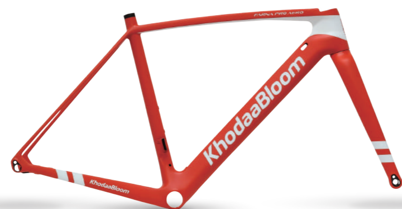
マットレッド (フレームセット)