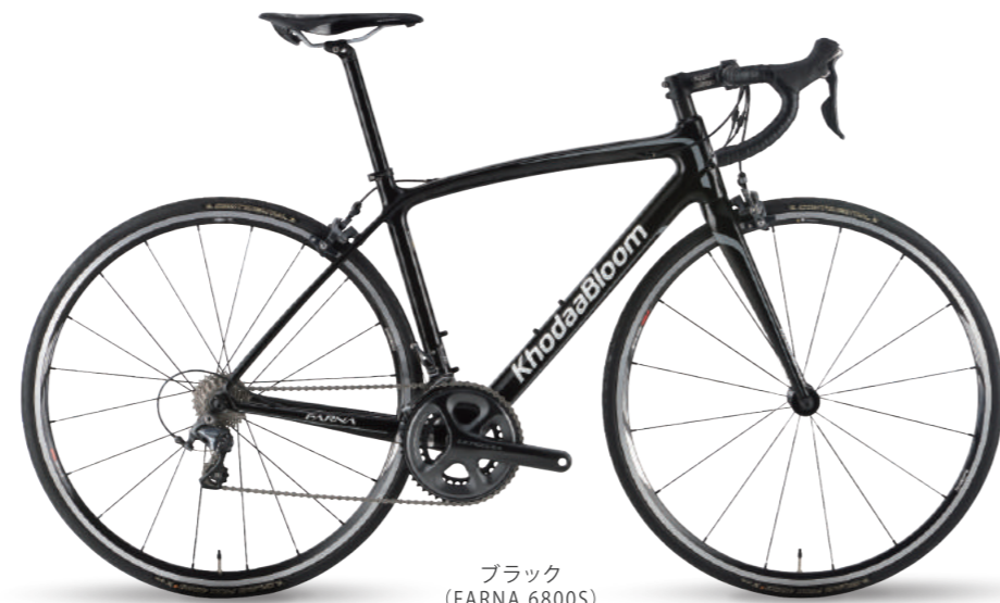
ブラック (FARNA 6800S)