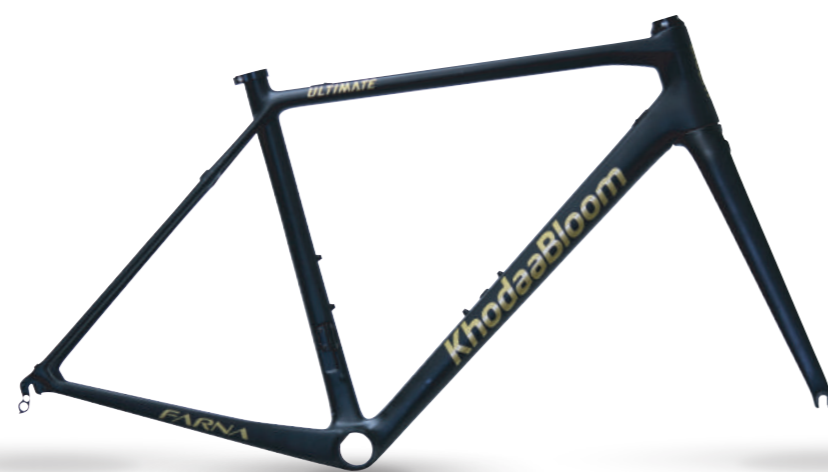
マットブラック (フレームセット)