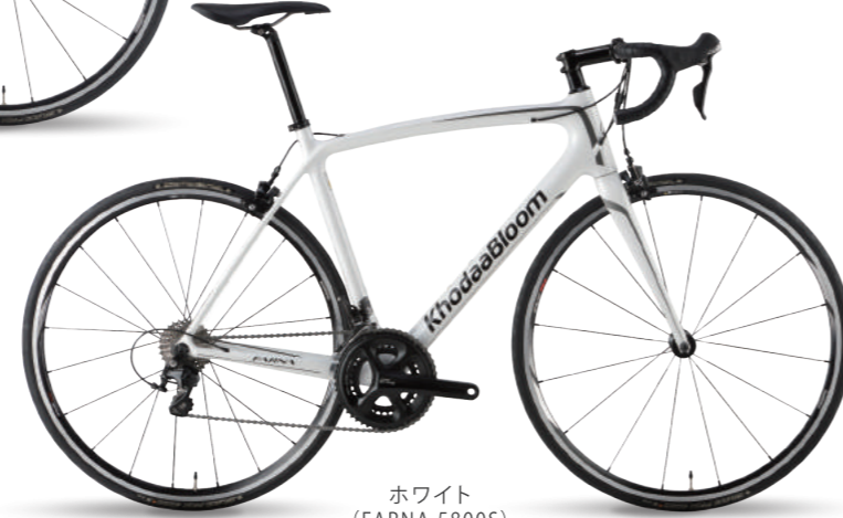
ホワイト (FARNA 5800S)