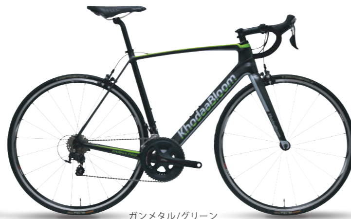
ガンメタル/グリーン