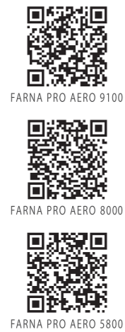
FARNA PRO AERO 9100