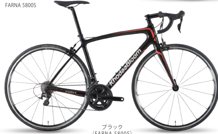
ブラック (FARNA 5800S)