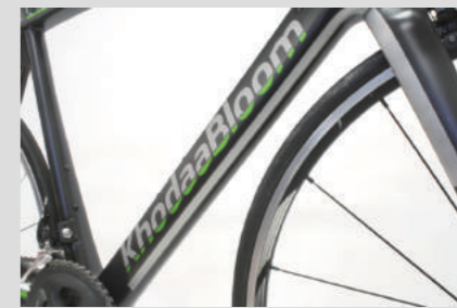
ガンメタル/グリーン